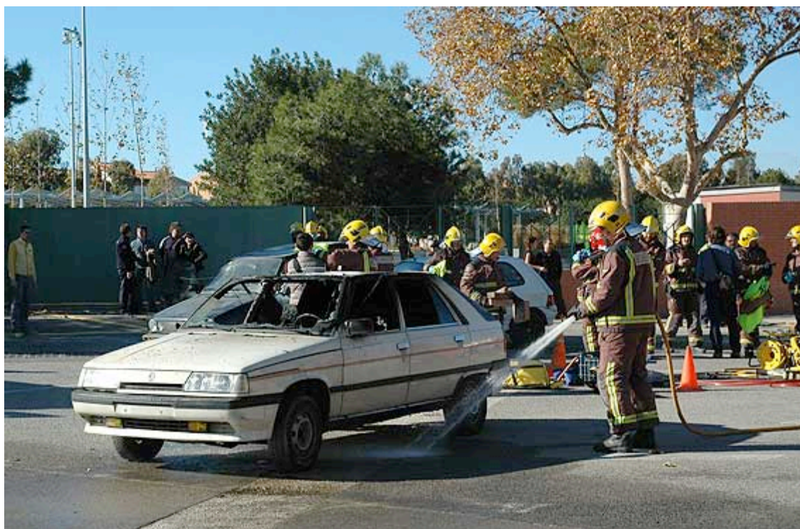
Un moment del simulacre que es va fer ahir al migdia davant del parc del Pinaret

La zona del Parc del Pinaret es va convertir ahir al migdia en l'escenari del simulacre d'un accident. UGT juntament amb la Direcció General de Trànsit van organitzar a Cambrils un curs de descarcelació, consistent en treure víctimes de vehicles, de tres dies de durada dirigit a bombers de tot Catalunya. El curs forma part dels cursos AFCAP, subvencionats amb fons europeus i destinats a la formació de personal funcionari.